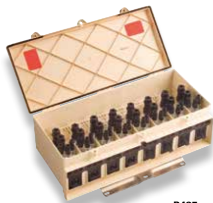
P435 7 sorties