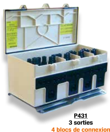
P431 3 sorties

3 branchements ou 7 branchements et 1 réseau